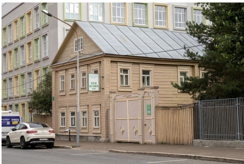
Музей Каюма Насыри

27 Августа 2024 В Казани отреставрируют музей Каюма Насыри – стены в аварийном состоянии. В Казани отремонтируют деревянный памятник архитектуры «Дом, в котором жил и в 1902 году умер татарский просветитель Каюм Насыри», расположенный на ул. Парижской Коммуны, 35. Сейчас здесь находится музей татарского деятеля. Проект сохранения здания разработал «Татинвестгражданпроект» и размещен на сайте комитета РТ по охране объектов культурного наследия.