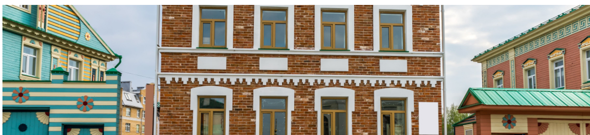
Музей Каюма Насыри

Музей Каюма Насыри- https://tur-kazan.ru/sights/muzej-kajuma-nasyri