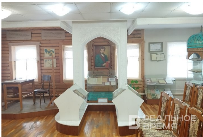
Один из залов музея Каюма Насыри.

Почему со дня рождения реформатора просвещения действительно прошло 200 лет